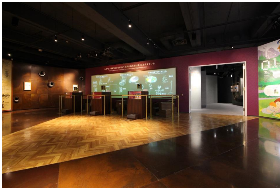
(参考：Zone 1 「“もの”と“情報”がつくる世界」)