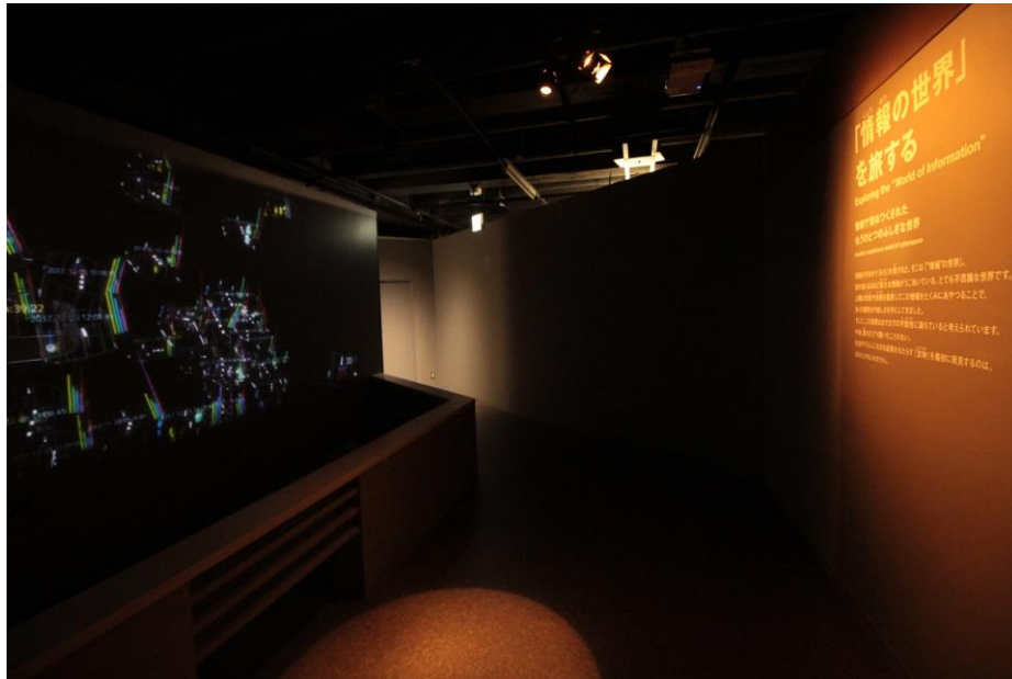
Zone 3 「『情報の世界』を旅する」